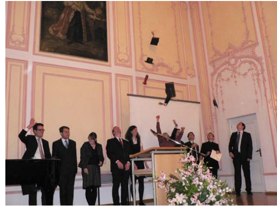
Fliegende Hüte: Die neuen Diplomtheologen und Diplomtheologinnen kreieren eine Neuheit

Zweifellos seien diese Bücher von herausragender Bedeutung, verliehen Verbindung mit den Anfängen der eigenen Glaubensgemeinschaft und dienten als Norm, die man auch missionierend weitergeben könne. Bibel wie Koran waren und sind auch kulturell prägend.